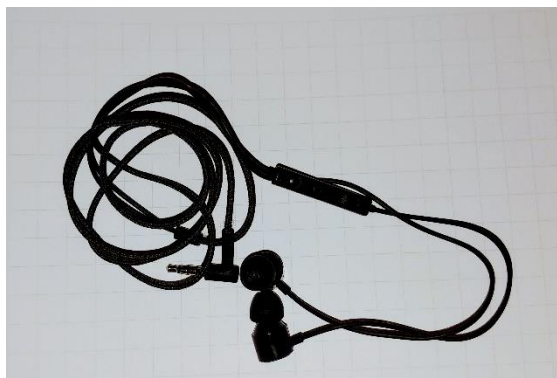
Headset mit Klinkenstecker (Kopfhörer mit Mikrofon)